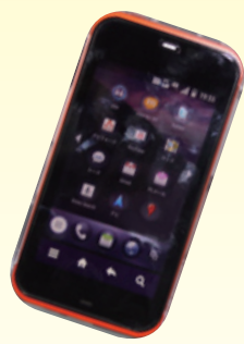
(上) 多機能なスマートフォンが来年以降も人気を集めるか

来年で最も流行、と圧倒的的支持を得たのはスマートフォン。次いで電子書籍が2位と電子メディアは長く流行ると予想された。しかし、同じ電子メディアでも今年注目された3D技術やiPadは不人気。大学生まで浸透するのはまだ先か。